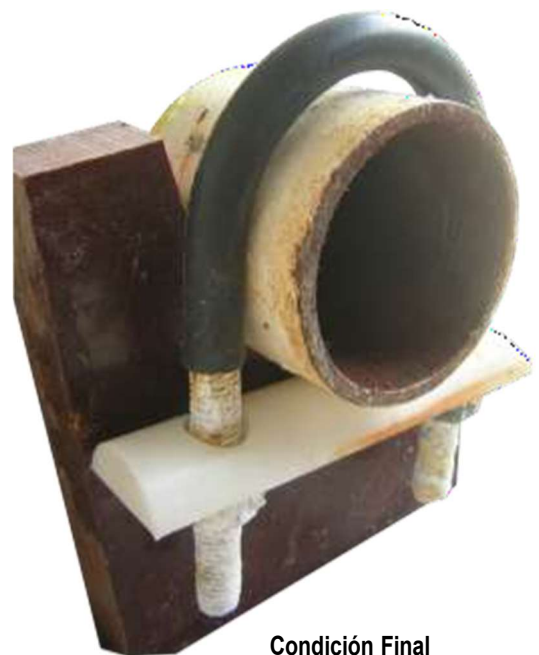
Condición Final 510 hr de Exposición