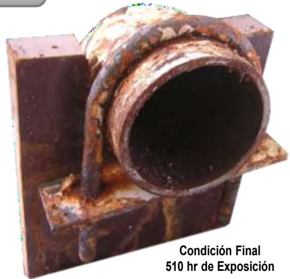
Condición Final 510 hr de Exposición